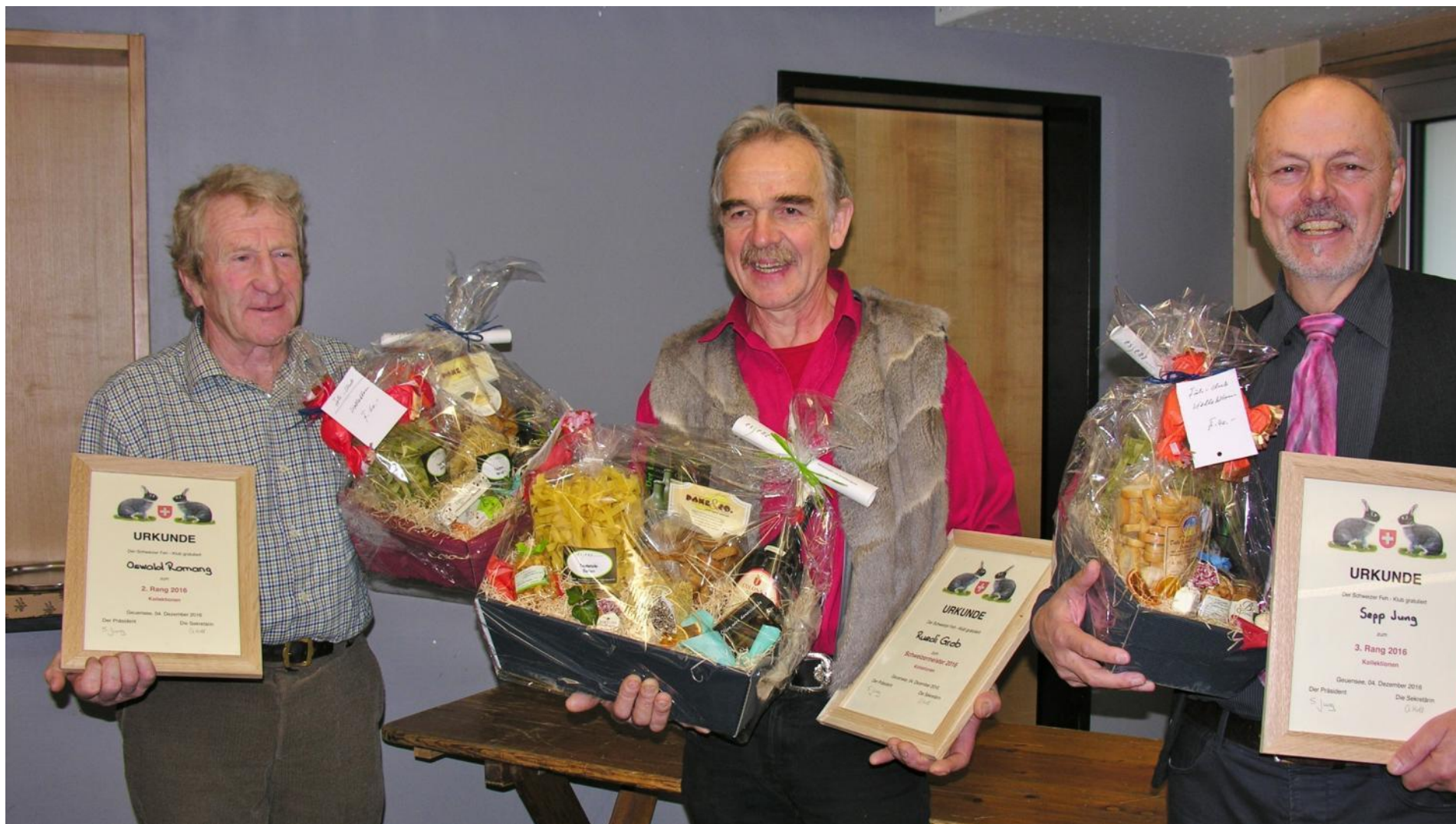
Klubschau 2016 in Geuensee