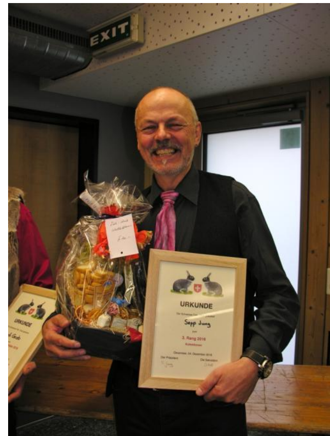
3. Rang Sepp Jung Gruppe Ost 96.2 Punkte