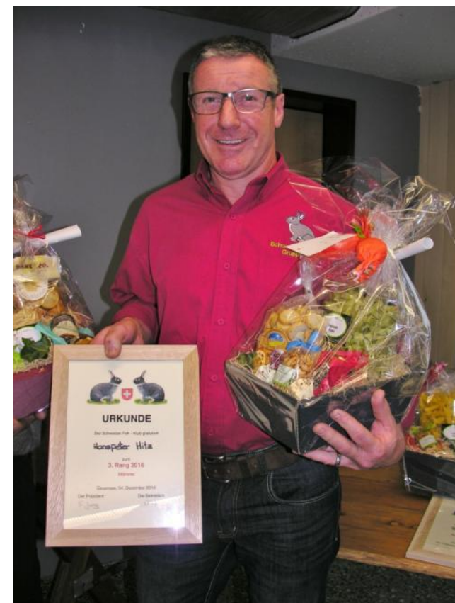
3. Rang Hampi Hitz Gruppe Ost 95.67 Punkte