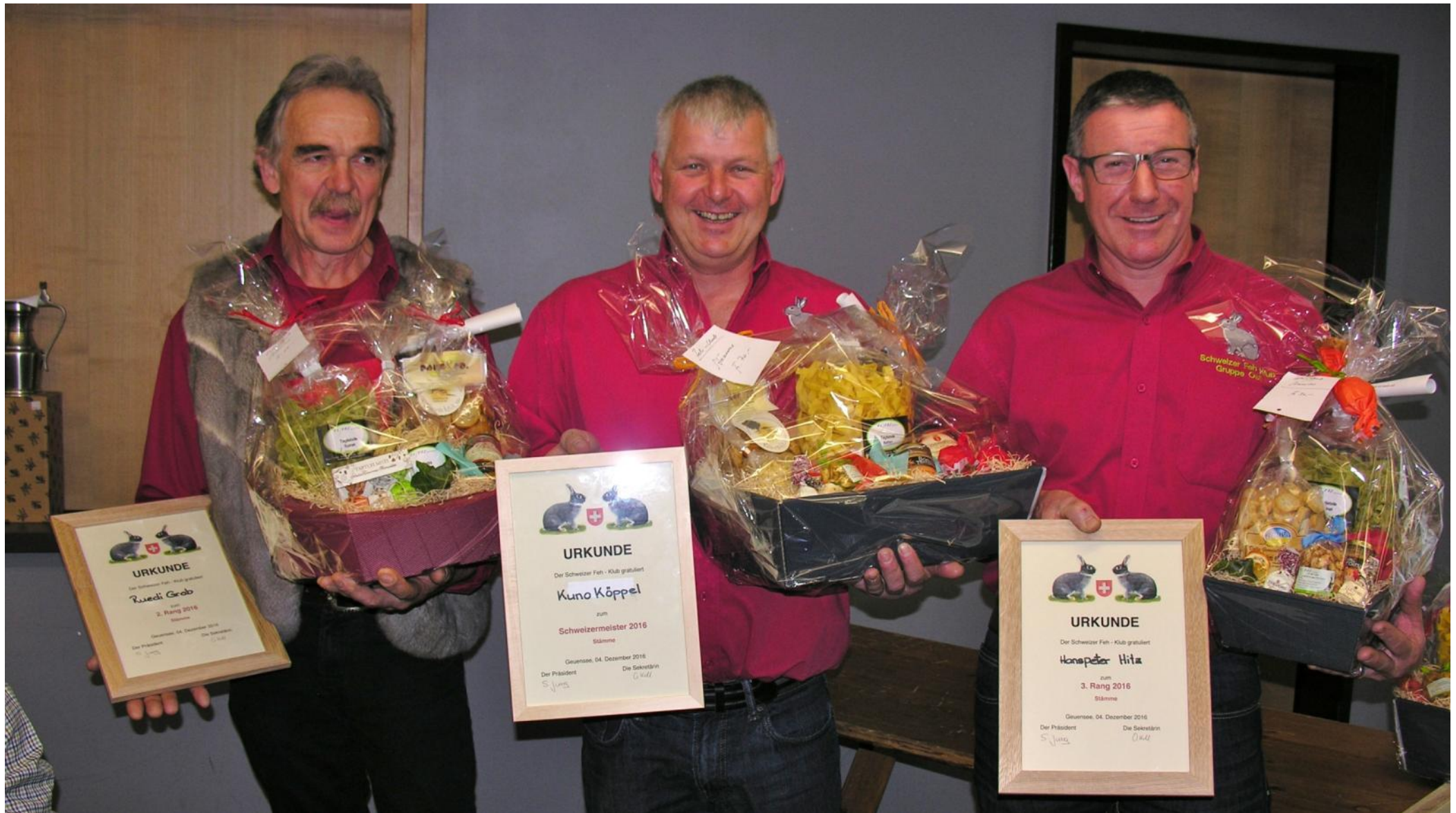
Klubschau 2016 in Geuensee